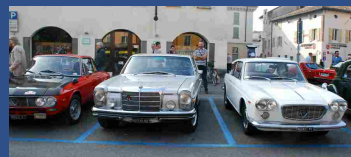
Ruote classiche tra le mura 2014